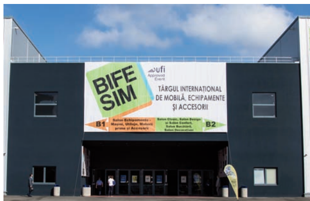
AFISARE BANNER PE FATADA PAVILIONULUI B3