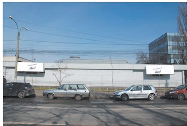
AFISARE BANNERE BD. EXPOZITIEI - ROMEXPO