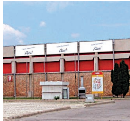
AFISARE BANNERE PE FATADA PAVILIONULUI C5