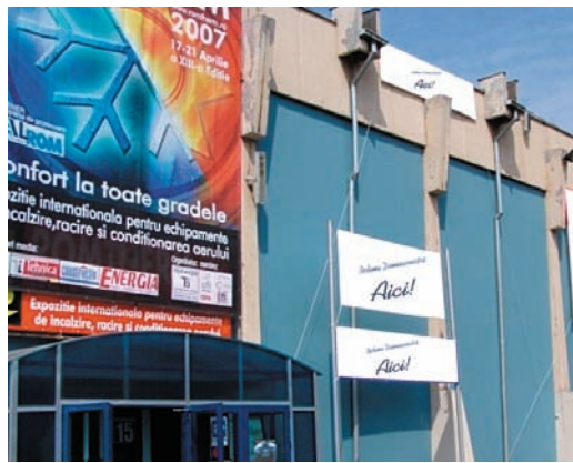
AFISARE BANNERE PE FATADA PAVILIONULUI C1