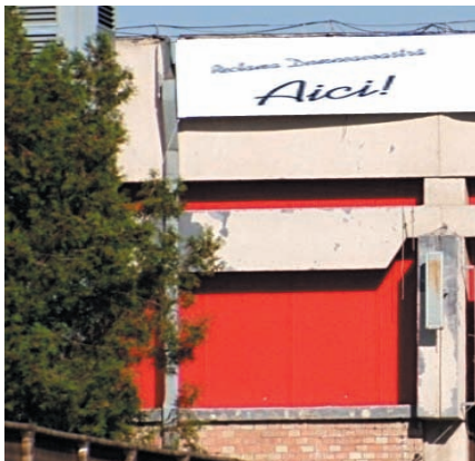
AFISARE BANNERE PE FATADA PAVILIONULUI C4