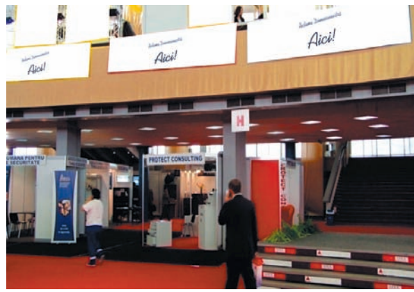
AFISARE BANNERE PAVILION A, FRIZA 4.50