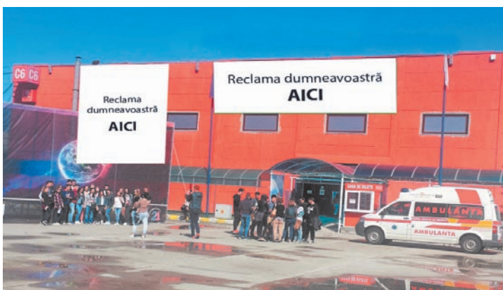
AFISARE BANNERE PE FATADA PAVILIONULUI C6